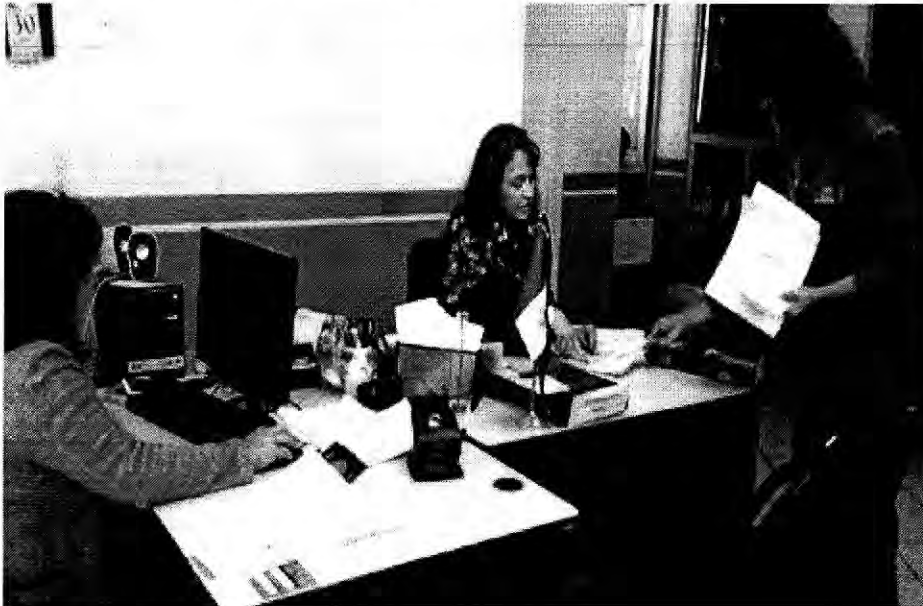
Aumenta demanda en vísperas de vacaciones. Ver más

Creado: Martes 05 Diciembre 2017 13:19 Escrito por ZacatecasOnline