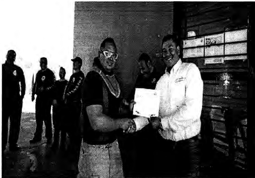
Reciben reconocimientos. (Coltest)

Creado Lunes 11 Diciembre 2017 01:14 Escrito por ZacatecasOnline