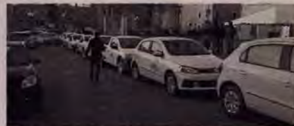
Se invirtieron dos millones de pesos en 10 vehículos.

administración nos percatamos que muchas áreas estaban saturadas de personas y de acuerdo a los indicadores que nos da el Instituto Nacional para el Federalismo, de acuerdo al número de población que tenemos en Fresnillo la nómina no debe exceder de mil 600 trabajadores y estamos excedidos de una manera extraordinaria teníamos más de 2 mil trabajadores.