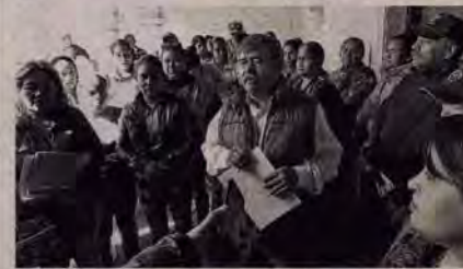
Exigen 716 paquetes de material para la construcción.

Una comisión no mayor a 50 antorchistas se dio cita en la Presidencia Municipal para dar a conocer los pendientes, los retrasos y para formular las obras de este año.