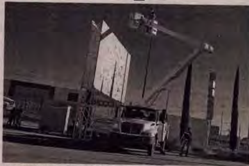
Se pretende mejorar el servicio de alumbrado público.