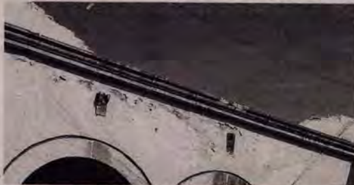
Los daños, aunque son considerables, no requerirán de grandes inversiones para su reparación.

Serios daños presentó el edificio de la Presidencia Municipal, porque la lona que cubría el patio retuvo grandes cantidades de agua, por la lluvia del jueves y al caerse derribó parte de la barda de contención y dos escurridores.