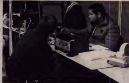
Desde temprana hora acuden para hacer sus pagos correspondientes.