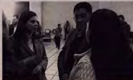
Autoridades buscarán darle viabilidad a los comedores.

Los que son de gobierno estatal los vamos a mantener, pero los que eran de gobierno federal iniciaremos el proceso para tratar de absorberlos porque en cada uno de estos comedores desayuna y comen por lo me-