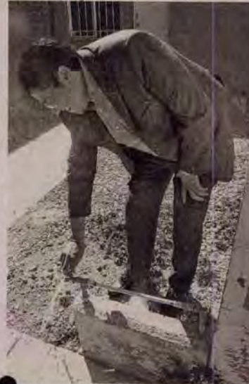
El alcalde reitera el compromiso con el sector empresarial.