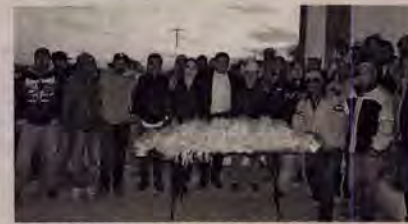
Los beneficiarios son de Boca de Río Chico y Leobardo Reynoso.

Agregó, si se capacitaron, pero les falta algo que precise la normatividad, será un holograma amarillo, en el caso de no capacitarse y no cubrir todas las normas, será rojo, y estará apercibido de regularizar su situación, si aún tiene permiso, si se capacitan, y cubren los protocolos de higiene, tendrán holograma verde, para que los consumidores tengan una señal visual para decidir si les es conveniente comer ahí.