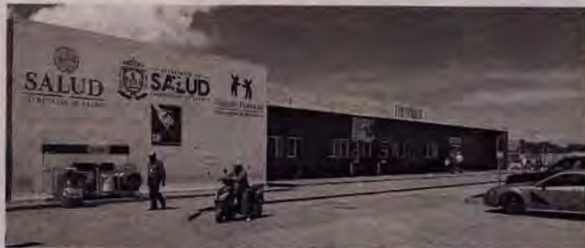
El Comedor Comunitario se pondrá a disposición de los familiares de pacientes internados.