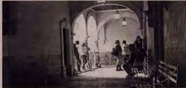
Buscan reducir la nómina de 2 mil a mil 600 trabajadores. / Servando Burciaga

Parques y Jardines, de estos espacios es la mayor cantidad de personas, porque es donde más personal hay. Aclaró, afortunadamente existen