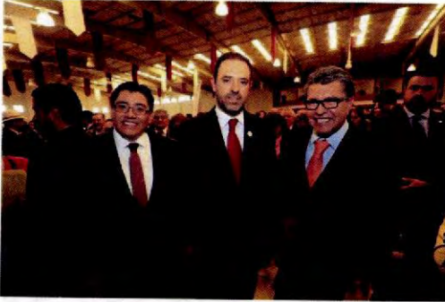
tripleerre TELLO NO LE FALLARÁ A FRESNILLO