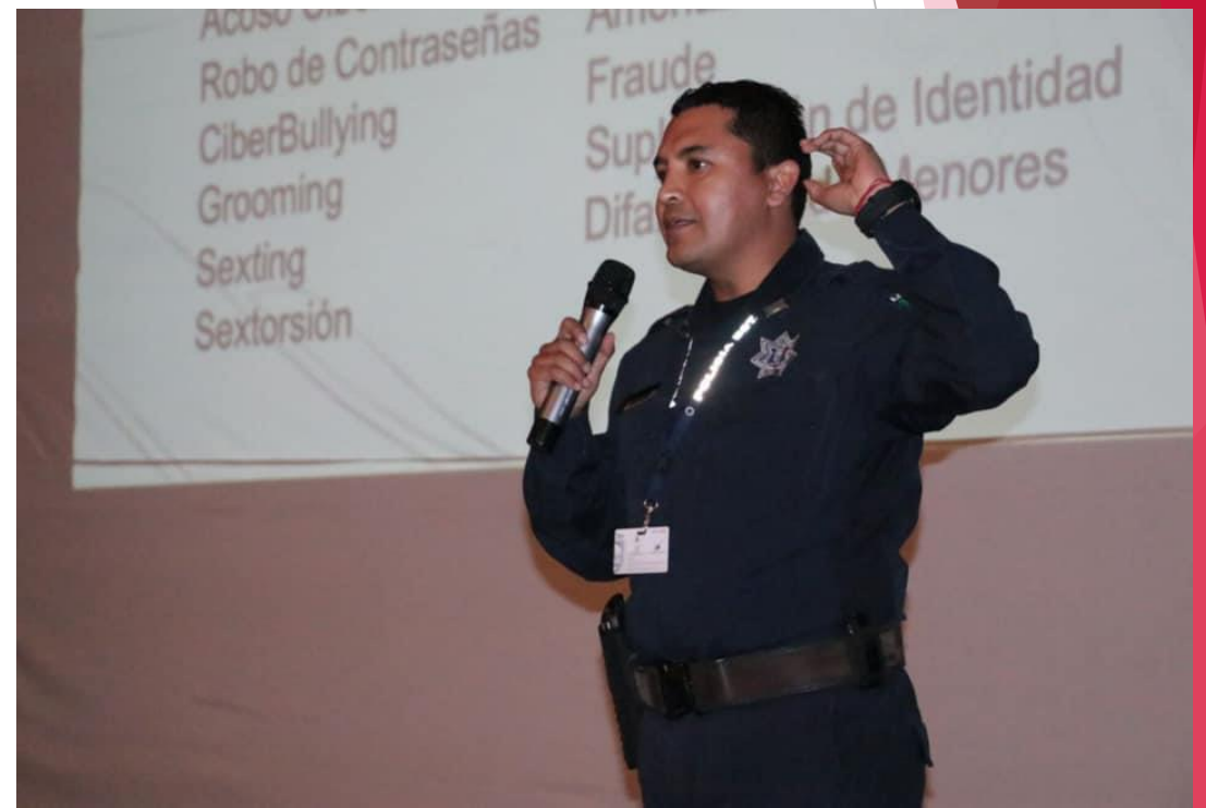
1era Jornada de Uso Responsable de las Redes Sociales