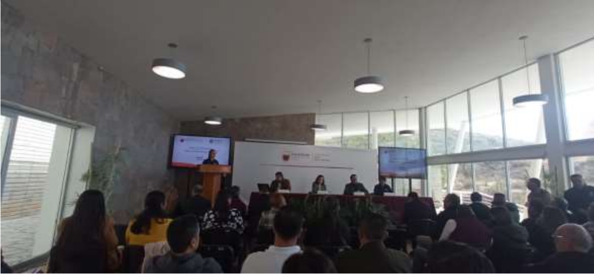
Campaña de educación ambiental para la revisión de los árboles en el CBTIS #1.