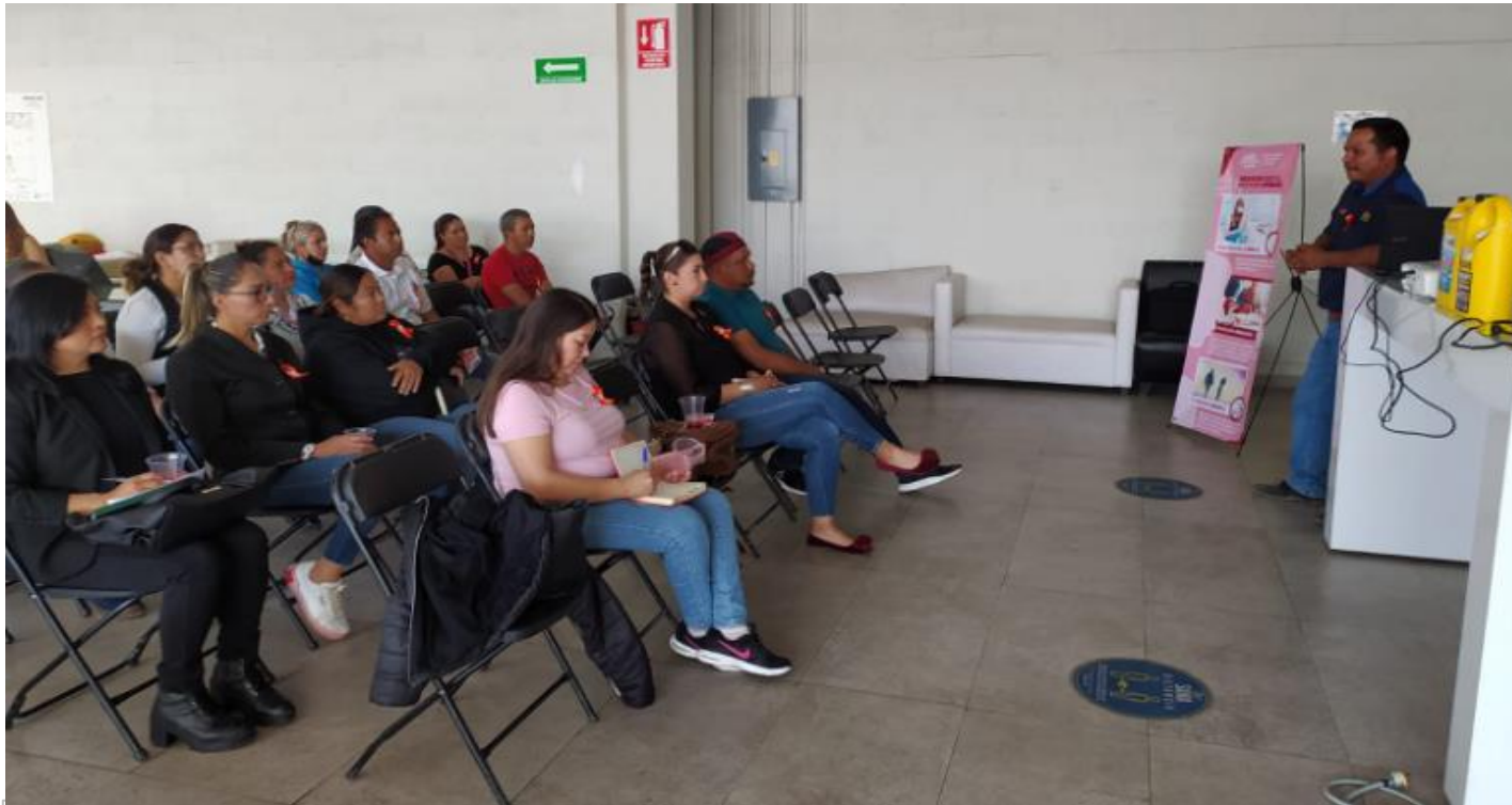
Curso de Mécanica básica para mujeres.