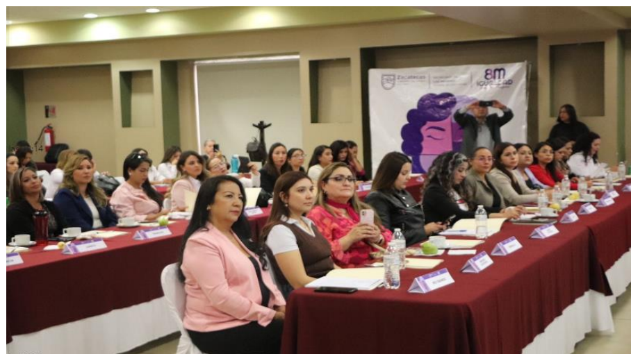
Encuentro Instancias municipales de la Mujer