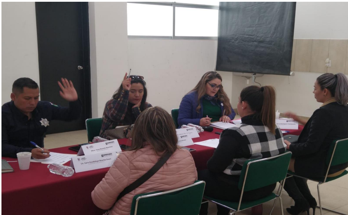
Primera Sesión Ordinaria de la comisión de Atención del (SMPASEV)