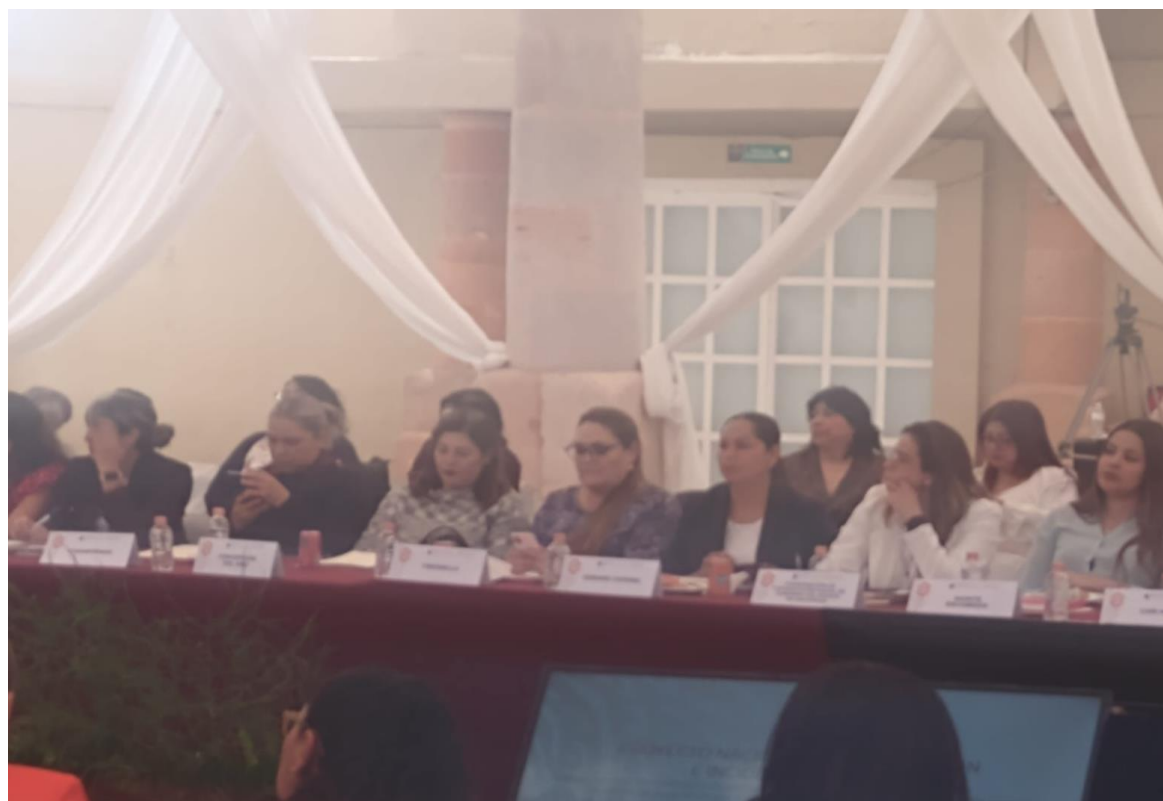
Trigesima Sesión del Sistema Estatal para Prevenir, Atender, Sancionar y Erradicar la Violencia contra las Mujeres

Del 01 de enero al 31 de marzo de 2023 (Actividades coordinadas por SEMUJER donde participa INMUFRE)