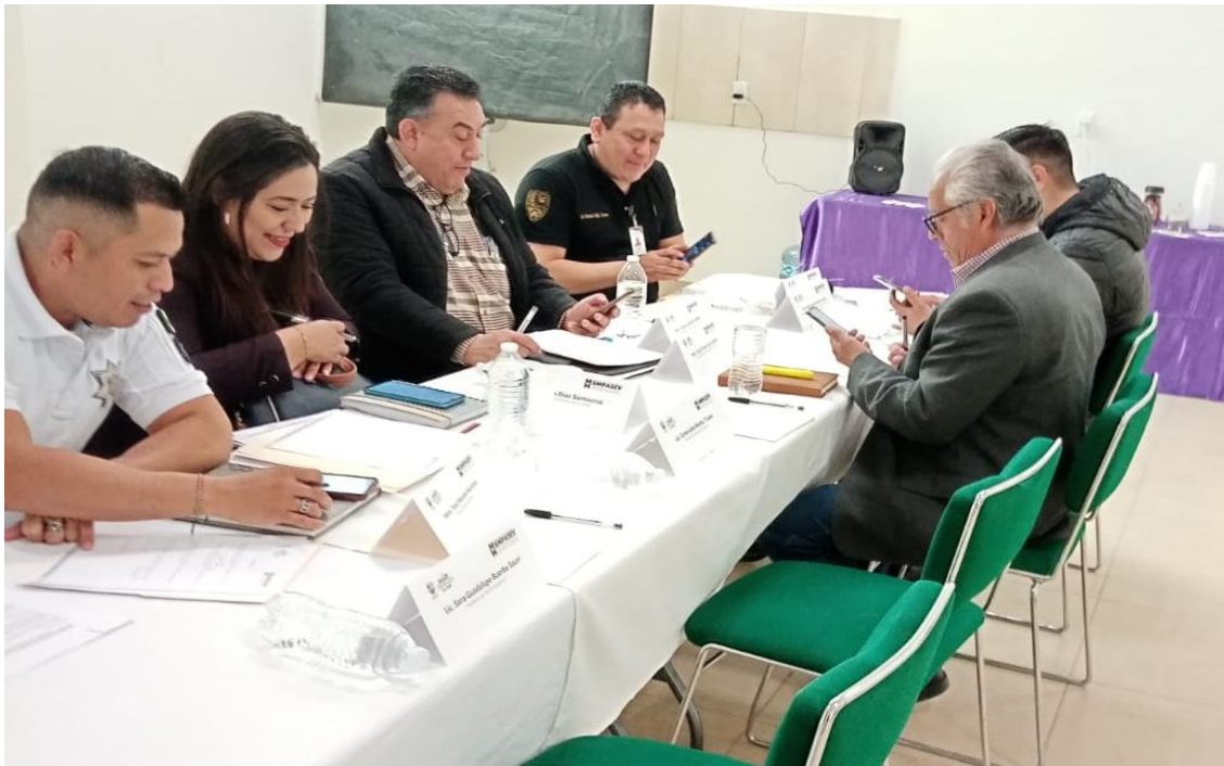
Primera Sesión Ordinaria de la comisión de Prevención del (SMPASEV)

* 17 titulares, 8 representantes y 5 público en general.