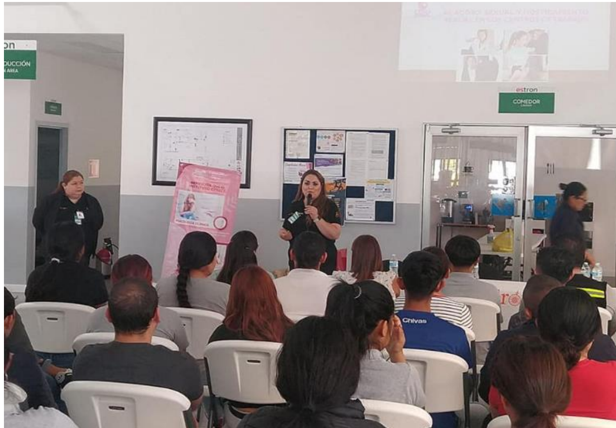
Capacitación denominada "Cero Tolerancia al Acoso Sexual y al Hostigamiento Sexual en el Área