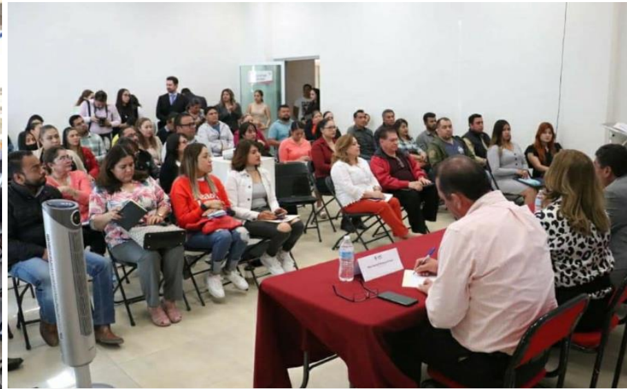
"Capacitación sobre Carga de Información a la Plataforma Nacional de