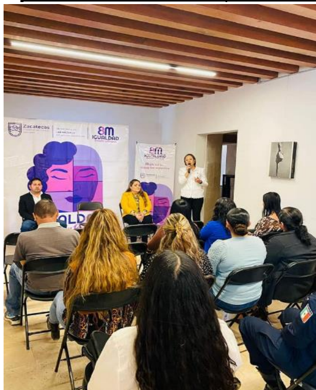
Capacitación Regional de sobre "Igualdad Sustantiva"

Del 01 de enero al 31 de marzo de 2023 (Actividades coordinadas por SEMUJER donde participa INMUFRE)