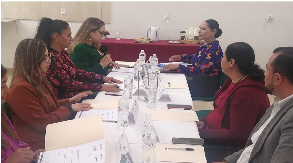
Primera Sesión Ordinaria de la comisión de Erradicación del SMPASEV.