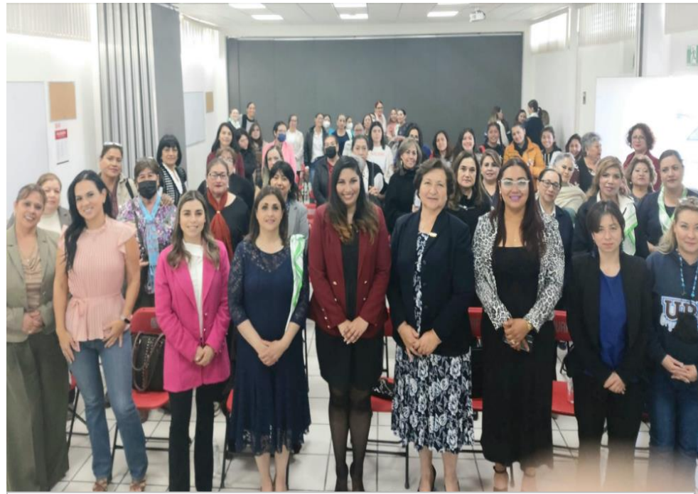
Conferencia denominada "Empoderamiento"