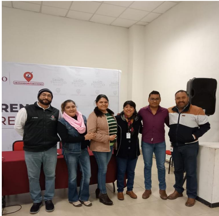
"Taller de Repliegue"