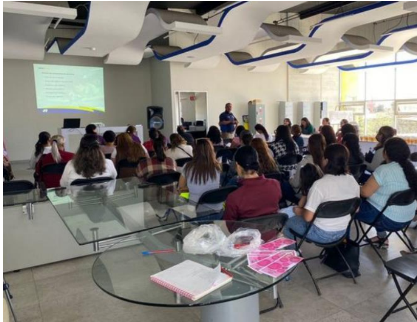
Taller de "Mecánica Básica"