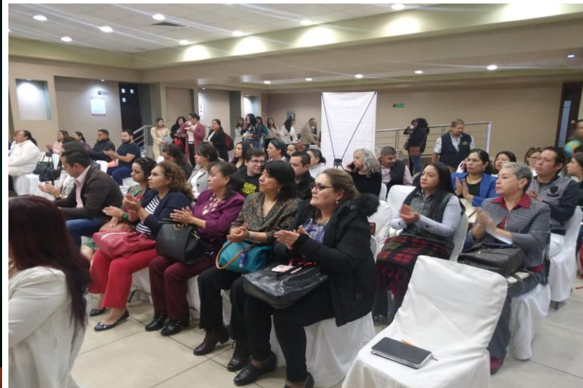
Capacitación Nacional sobre registro de casos de violencia