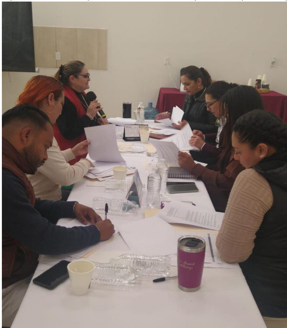
Primera Sesión Ordinaria de la comisión de Sanción del SMPASEV.