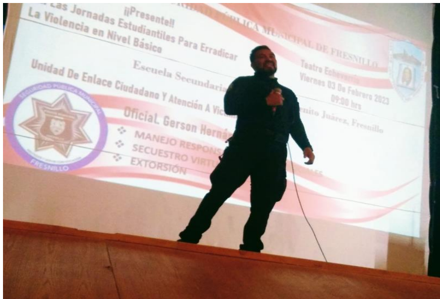
* Manejo Responsable en Redes Sociales; Secuestro Virtual y