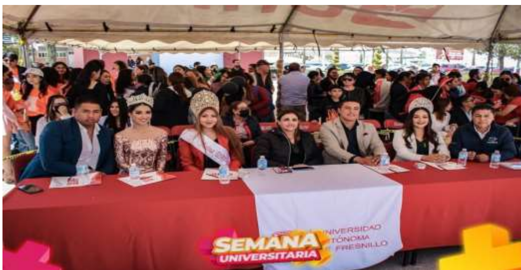
JUEZ EN PRESENTACION DE CANDIDATOS A REINA Y REY DE LA UAF 2023