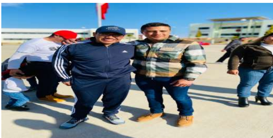
PASEO DOMINICAL EN EL 97 BATALLON DE INFANTERIA