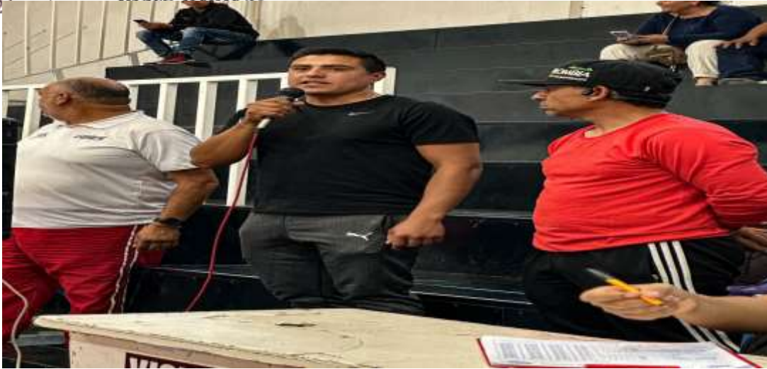
PARTIDO AMISTOSO DE BASQUETBOL ENTRE UPZ E ITSF