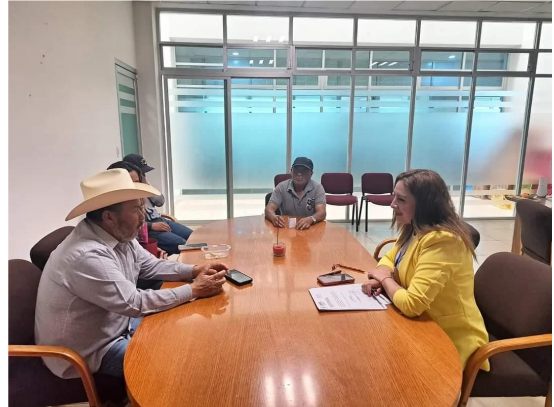
18 DE ABRIL, REUNIÓN DE TRABAJO CON REL COORDINADOR DE DELEGADOS MUNICIPALES