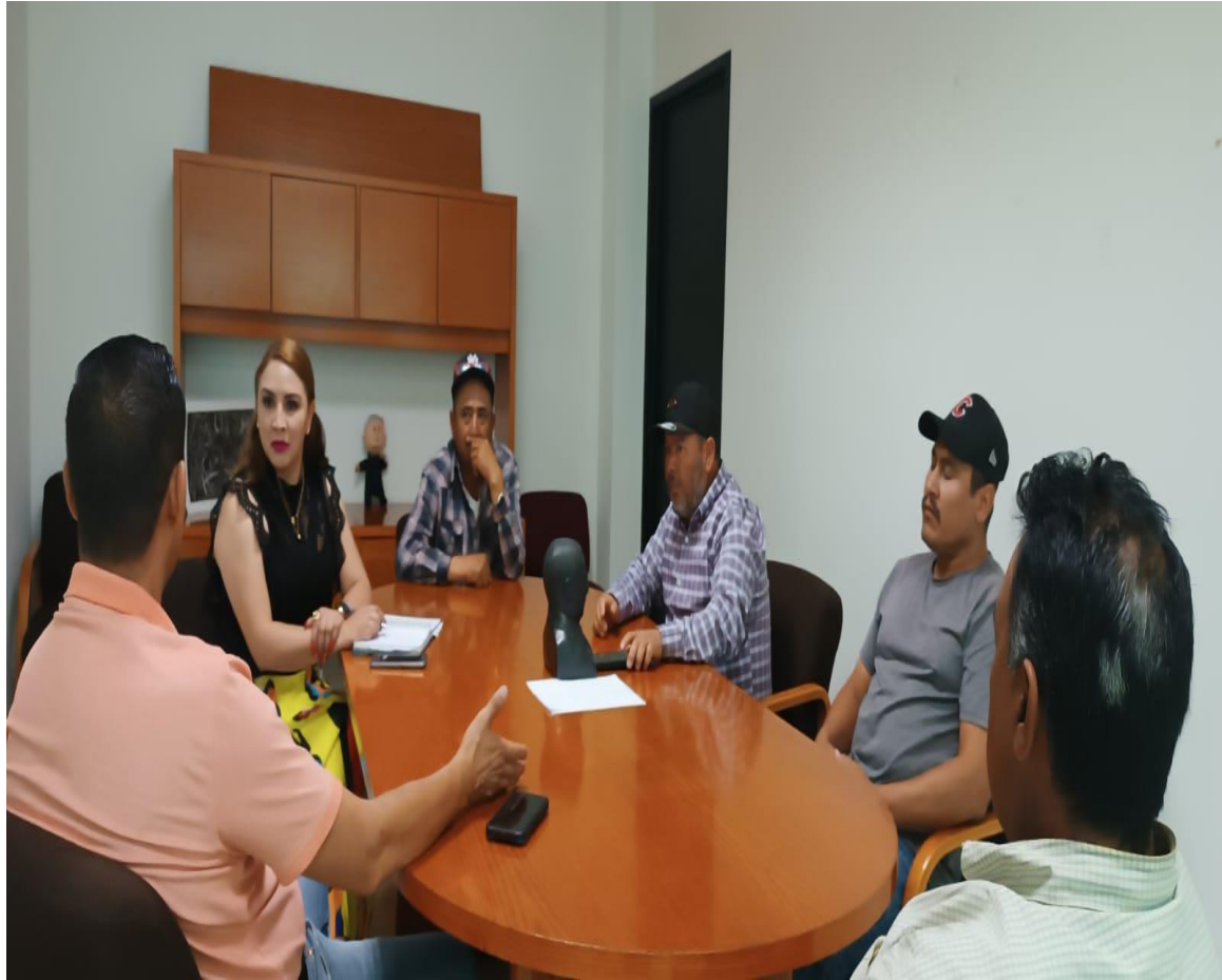
29 DE MAYO, REUNIÓN CON DELEGADOS MUNICIPALES.