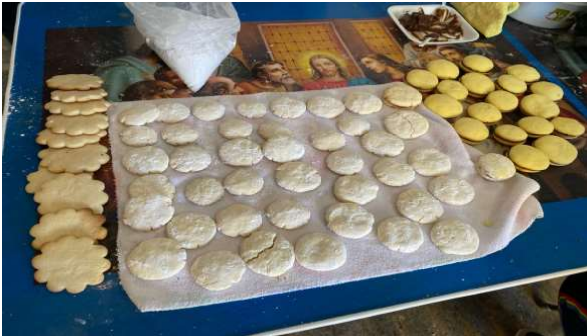
18 DE NOVIEMBRE: Curso de repostería en la Comunidad de Redención; con la elaboración de galletas.