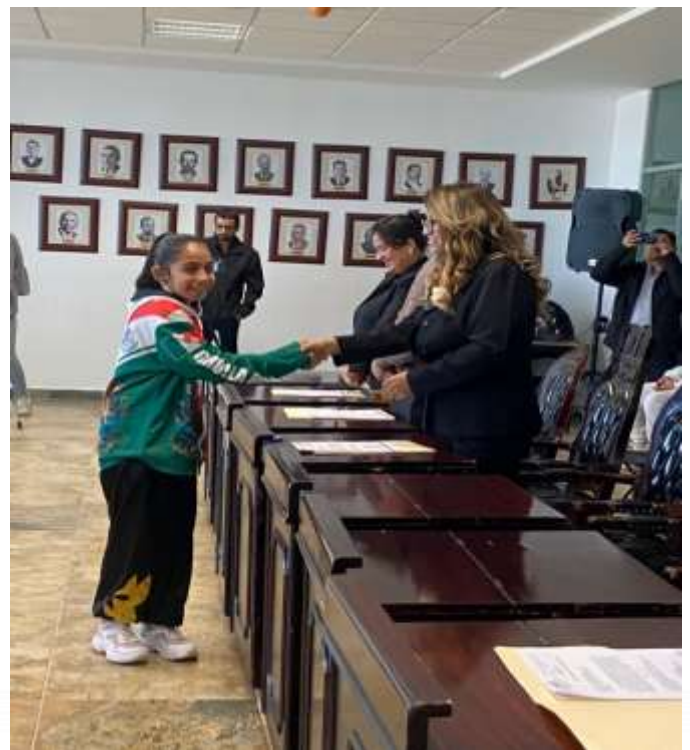
20 DE NOVIEMBRE: Sesión Solemne Pública de Cabildo, entrega del Premio Municipal del Deporte 2023.