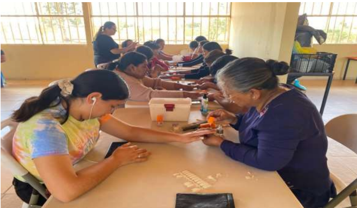
21 DE OCTUBRE: Curso de aplicación de uñas avanzado en la Comunidad de Milpillas.