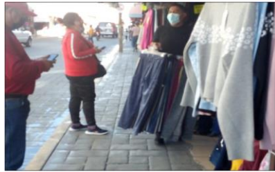
Se realiza el cobro de uso de suelo en los diferentes tianguis.