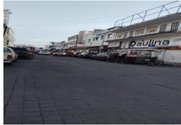
Diariamente se inspecciona y se regulariza al comercio en el centro.