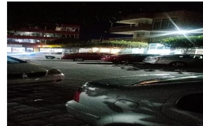
Se realiza diariamente recorrido y cobro de ruta nocturna de centro, periferia y colonias.