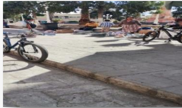
Se retira a comerciantes foraneos del centro del municipio.